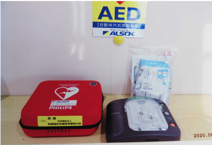
老人介護施設に寄贈したAED