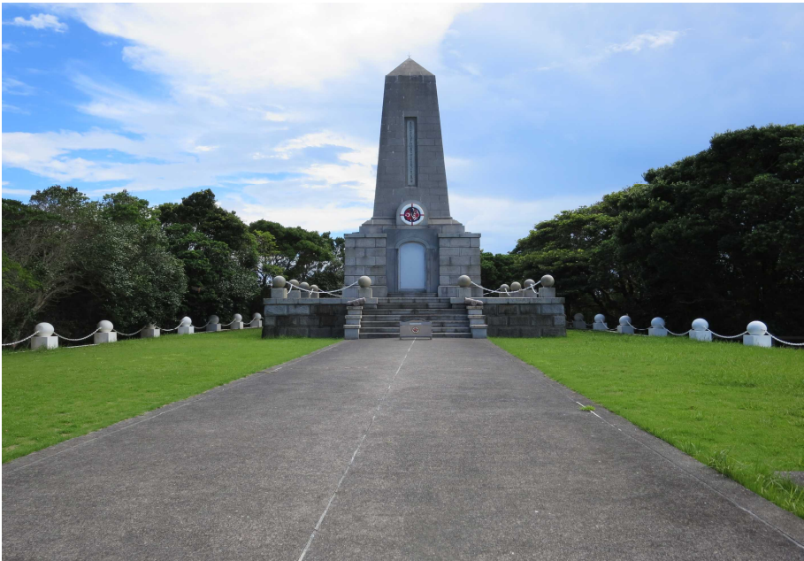
トルコ軍艦遭難慰霊碑(串本町大島)