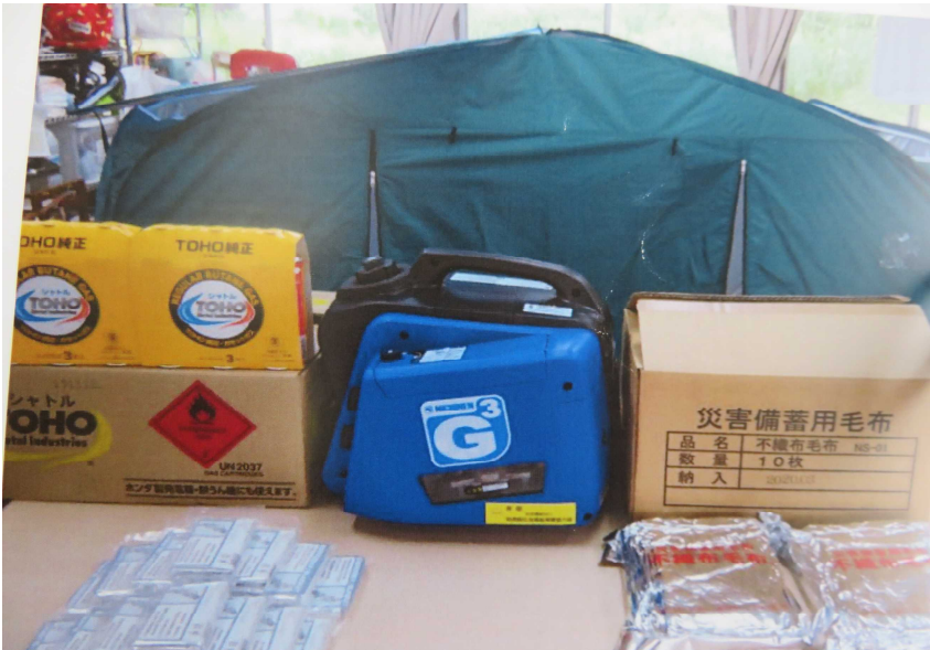
障害者支援施設に寄贈した非常用発電機